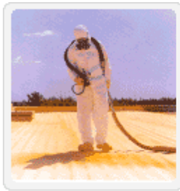
▲ Spray 보온단열재