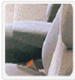
▲ Arm Rest

Cosmonate M-100 은 건축용 단열재 패널, Spray 보온 단열재 Pipe 단열재와 같은 경질 폴리우레탄 폼 분야 및 자동차의 내장재인 In-panel, Sun Visor, Arm Rest 와 같은 반경질 폴리우레탄 분야에 폭 넓게 사용되고 있다.