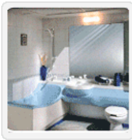
▲ 일체형 욕조 내장재