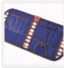
▲ Sun Visor